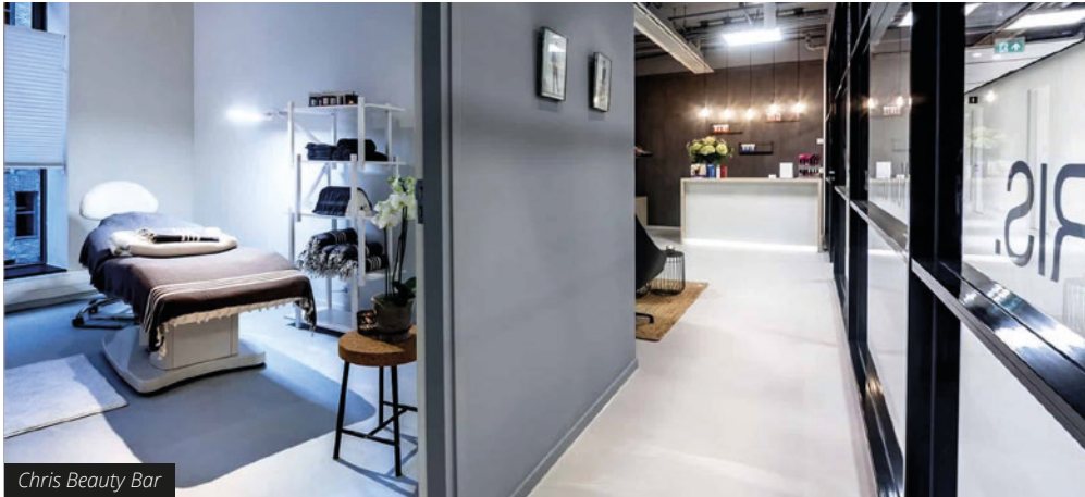
Chris Beauty Bar